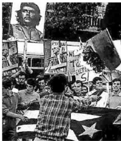
1978: Aldo Moro prigioniero delle Brigate rosse. A sinistra, un corteo del 1968

Negli ultimi mesi sono usciti alcuni romanzi che ricostruiscono in chiave storica o fantapolitica gli Anni '70 del terrorismo, del sequestro Moro e del «Buio Rivoluzione». Parlano gli autori, talvolta nati dopo quelle stagioni, spiegando il perché di quest'ossessione per i misteri politici della nostra storia